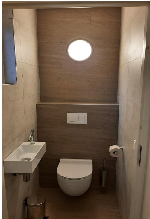
Impressie nieuw toilet