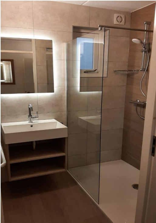
Impressie nieuwe badkamer